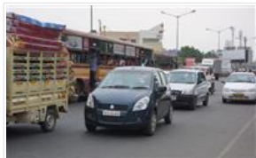
自動車大手、インド市場に投資拡大 スズキは新工場、ホンダは能力増強 モディ政権で市場回復