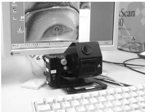
Fig. 3 A gaze tracking system "FreeGaze".

ステップにより構成される (図 2) (注1)。前者はステレオカメラの視差, カメラのフォーカス値などを利用することで測定可能である。一方, 後者については眼球形状の個人差, 眼鏡装着者の場合は眼鏡表面における屈折の影響等, 外界から測定困難な各種要素に起因する誤差のため, キャリブレーションが必要となる。従来は画面上に表示された 5 から 20 点のマーカを順次注視し, マーカ位置と算出した注視点のずれに基づき視線ベクトルの補正をおこなっていた。